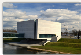
BRAMA POZNANIA Ostrów Tumski, nowoczesna narracja.